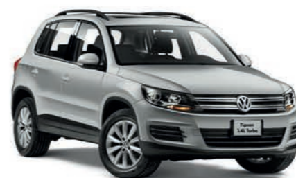
Catégorie 4X4 / S.U.V.